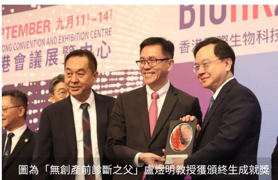
圖為「無創產前診斷之父」盧煜明教授獲頒終生成就獎