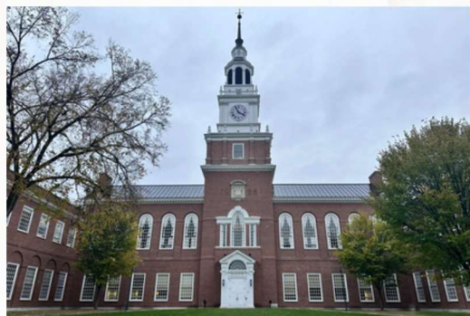
達特茅斯學院

1950 年，英國數學家艾倫·圖靈的貢獻進一步推動了人工智能的理論框架。他在論文《Computing Machinery and Intelligence》中提出了著名的「圖靈測試」：如果一臺機器的對話行為能讓人類無法區分它與真實人類的差異，那麼就可以認為這臺機器具有智能。這