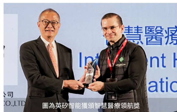
圖為英矽智能獲頒智慧醫療領航獎

BIOHK 組委會每年均設立多元重磅獎項，涵蓋終生成就獎、企業家獎、各行業成就大獎等榮譽。BIOHK2026 獎項提名通道已全面開啟，誠邀您自薦或推薦行業標杆。 2