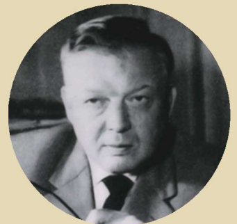
Karl von Frisch 1886~1982

福斯曼，德國外科醫師。諾貝爾生理學或醫學獎獲得者。生於柏林，卒於紹普夫海姆。1922年進入柏林大學醫學院，1928年畢業獲醫學博士學位。後在德累斯頓任泌尿科醫師。1929年他將在射線下不透明的導管插入自己的肘部靜脈，用X射線追蹤使它沿著靜脈安全地到達心臟。先後6次用自己的身體證明導管可通過血管到達心臟。首次研製出一套實用心臟導管插入系統。1930年福斯曼在活狗身上進行心血管造影術，並通過插入右心的導管斜穿過右心房進入下腔靜脈，直接收集從肝臟來的血液，進行代謝方面的研究，為研究循環系統的病理變化開闢了新途徑。第二次世界大戰中服役被俘。1945年獲釋後由於心臟導管檢查術未受醫界的重視和支持，被迫放棄轉做泌尿科醫師。1954年成為戈登堡大學外科和泌尿科名譽教授。因對心血管術的研究，與庫爾南（A.F.Cournand）、理查茲（D.W.Richards）共獲1956年諾貝爾生理學或醫學獎。20世紀50年代以來，福斯曼的心臟導管術在臨床上日趨成熟，應用更為廣泛，可幫助測定心內和血管各部分的壓力及血液含氧量，對進行直接心血管造影術以及研究心、肝、腎的代謝機能均有很大臨床價值。