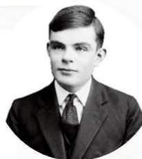
艾倫·圖靈（1912年6月23日~1954年6月7日）及其提出的圖靈機概念圖，圖片來源於網絡。圖靈，英國計算機科學家、數學家、邏輯學家、密碼分析學家，被譽為「計算機科學之父」、「人工智能之父」，英國皇家學會院士。

個簡單卻深刻的判斷標準，至今仍是衡量機器智能水準的重要參考，而圖靈本人也因此被尊為「人工智能之父」。他的思想不僅打破了「智能專屬人類」的傳統認知，更為後續的研究提供了清晰的目標——讓機器具備與人類相似的思考與交流能力。