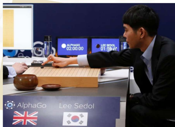
AlphaGo 與李世石大戰

2016年，人工智能領域迎來了又一個「歷史性時刻」——由 DeepMind 開發的 AlphaGo 與世界圍棋冠軍李世石展開了一場舉世矚目的對弈。圍棋被譽為「人類智慧的