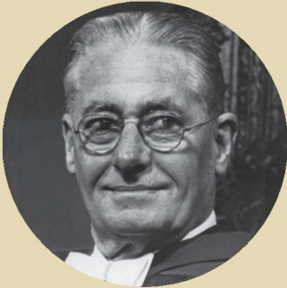
Howard Walter Florey 1898 ~ 1968