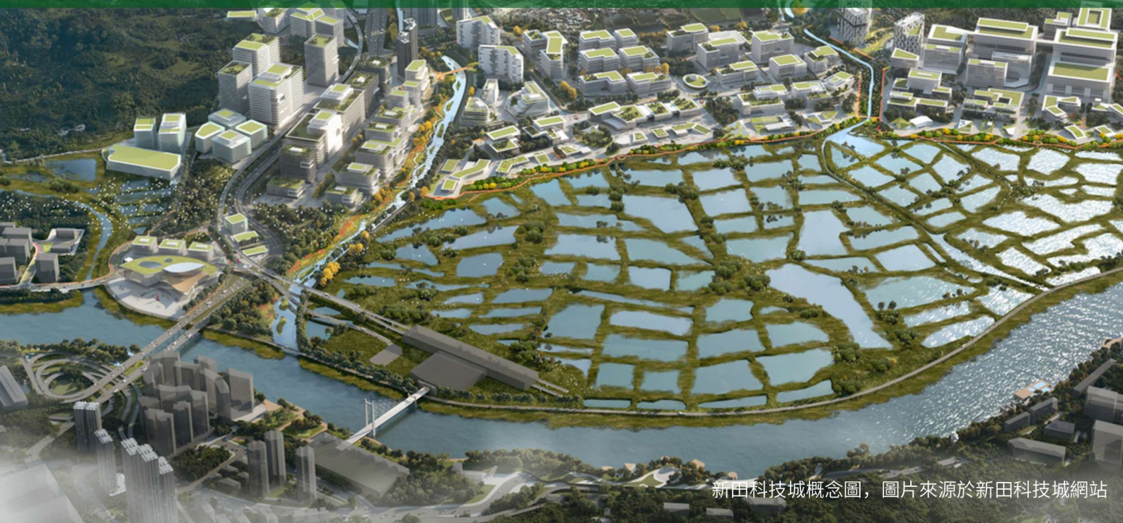
新田科技城概念圖