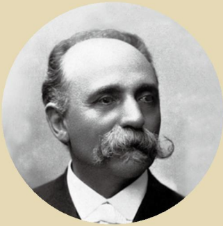
Camillo Golgi 1843 ~ 1926