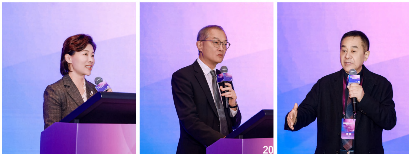
左至右分別為郭子平主任、盧寵茂局長、于常海主席

深港生物科技領域的合作，早已超越簡單的項目對接，邁入「機制共建、生態共築、要素共通」的深度融合階段。在制度創新層面，河套深港科技創新合作區打破跨境科研協作的政策壁壘，實現研發設備、實驗樣本、科研人員的便捷流通，為「香港科研+深圳轉化」的閉環模式提供「一站式」支撐，讓兩地聯合攻關無需受地域限制。在產業協同層面，「基礎研究在香港、技術轉化在深圳、市場應用通灣區」的分工體系已然成型，香港的國際科研視野、成熟知識產權體系與全球資源對接能力，與深圳完備的產業鏈條、活躍的創新企業集群、充足的產業空間形成精準互補，構建起從源頭創新到產業落地的全鏈條賦能生態。在要素流通層面，深港聯合搭建的臨床試驗協作機制，實現跨境多中心試驗方案同步審批、數據互認，大幅縮短藥械產品研發週期，為創新成果快速走向市場打通關鍵通道。