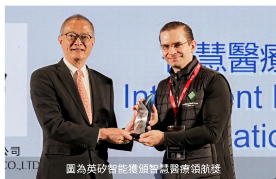
圖為英矽智能獲頒智慧醫療領航獎

BIOHK 組委會每年均設立多元重磅獎項，涵蓋終生成就獎、企業家獎、各行業成就大獎等榮譽。BIOHK2026 獎項提名通道已全面開啟，誠邀您自薦或推薦行業標杆。 2