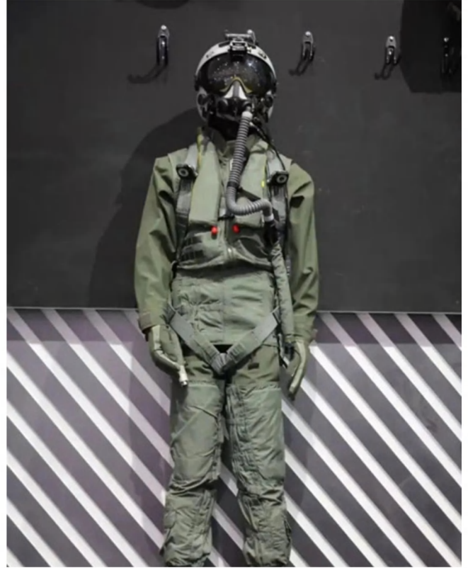
圖為抗荷服

我們總能看見太空人「漂浮」在空間站內部，這並非引力消失，而是因空間站及其內部物體都在地球引力作用下做自由落體運動（環繞地球的軌道運動本質上是持續的自由落體）。在這個自由落體的參考系中，物體（包括太空人和血液）感受不到支撐力，因此表現為失重（Weightlessness，實際上軌道高度重力約為地表90%）。重力梯度的消失，將導致血液從下肢和腹部向頭部和胸部轉移，初期或引發面部浮腫、鼻塞、頸部靜脈怒張以及中心靜脈壓升高。而在持續的失重環境下，人體生理系統會經歷一系列改變：首先，體液調節會發生顯著紊亂，因重力梯度消失導致頭部體液分佈增加，身體錯誤地認為「水太多」，從而