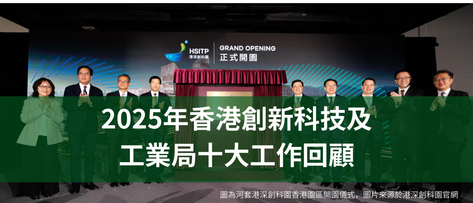
圖為河套港深創科園香港園區開園儀式