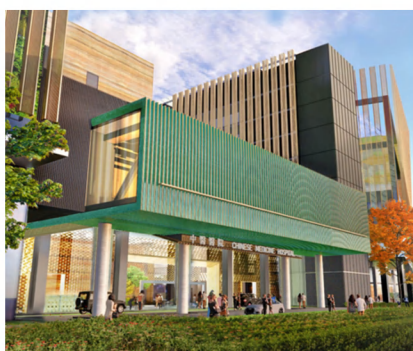
香港中醫醫院全景圖

港科大計畫未來25年投入70億港元建設醫學院，初期以清水灣校園為基地，後續遷入北部都會區大學城。目前已有36名國際資深教授表達加盟意願，2027年前啟動全球招生，非本地生比例預計達四分之一至三分之一。