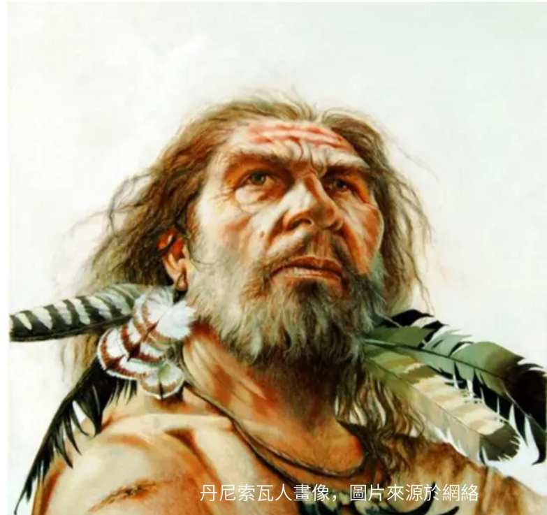
丹尼索瓦人畫像

同期，中國昆明市第一人民醫院聯合雲南農業大學團隊，成功將 8 基因編輯豬肝原位移植至恒河猴體內，實現超 210 小時功能性存活，刷新我國相關紀錄。團隊在 16 倍顯微鏡下完成精密血管吻合，通過新型灌注方式解決凝血難題，術後豬肝各項功能正常，為人類異種肝移植奠定技術基礎。