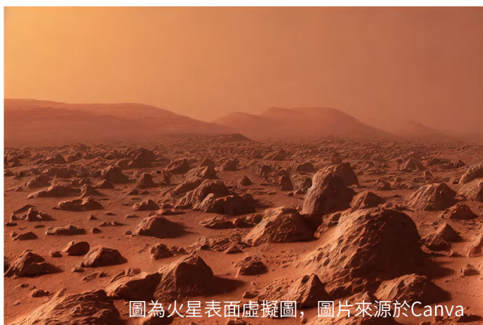
圖為火星表面虛擬圖

儘管如此，深入研究不同重力下的血液動力學具有不可替代的戰略意義。它是保障太空人在軌健康、提升高性能戰機飛行員抗荷能力、設計未來星際載具生命支持系統的基石。隨著中國空間站科研任務的深化、載人月球探測的推進以及深空探測藍圖的展開，血液動力學作為連接生命與星辰的紐帶，其研究成果將直接服務於人類向未知進發的好奇心。贏得這場百萬年博弈，不僅是對生命奧秘的探索，更是人類文明邁向深空的堅實一步。