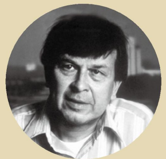
Daniel Carleton Gajdusek 1923 ~ 2008

蓋達塞克，美國醫學家、病毒學家。諾貝爾生理學或醫學獎獲得者。生於紐約州揚克斯，卒於挪威特羅姆瑟。1939年入羅切斯特大學學醫。畢業後入哈佛大學醫學院，1946年獲得醫學博士學位。1952年任哈佛的兒科學和傳染性疾病研究員。1952~1955年在華盛頓的瓦爾特里德陸軍醫學中心研究所和德黑蘭的巴斯德研究所工作。1955年在澳大利亞墨爾本的瓦爾特和艾麗莎霍爾醫學研究所做訪問學者時，開始多種衰退性神經系統紊亂致病因子的研究。對庫魯病（只發生在新幾內亞部落居民中）的獨特中樞神經系統紊亂進行第一次醫學描述，證實其病原是一種作用極慢，或能休眠數年的病毒感染。此後，又發現另一種神經變性病—古茲菲德—雅各布氏病。他的工作對此類大腦衰退性疾病病因的研究具有重大指導意義，研究表明這些疾病是由被叫做朊病毒的特異性感染因子造成的。因首次發現庫魯病及在發現感染性疾病的起源和傳播的新機制方面有傑出貢獻，與布盧姆伯格（B.S.Blumberg）共獲1976年諾貝爾生理學或醫學獎。