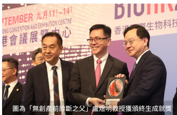
圖為「無創產前診斷之父」盧煜明教授獲頒終生成就獎